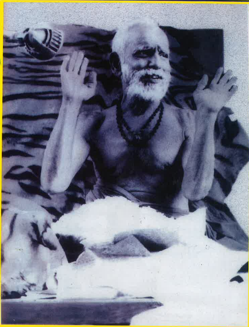
புஜ்யபுரு சந்திரசேகரேந்திர ஸரஸ்வதி பூ சரணாகள்

திருக் கார்த்திகையில் ஏற்றிவைக்கிற தீபம் அதன் விவளிச்சம் படும் இடமெல்லாம் பூச்சி - பொட்டு, மரம் - மட்டை உள்பட எல்லாவற்றிற்கும் ஜனன நிவிருத்தி அளித்து பேரின்பம் அளிக்கும் என்கிறபடி, ஸாக்ஷாத் ஜகன் மாதாவுக்கு ஜகதாசார்யாள் பண்ணும் இந்த தீபாராதனை - அதாவது இந்த ஸ்தோத்திரத்தின் அருளொளி - ஸமஸ்த பிராணிகள் மேலேயும் வீசி அன்பு என்கிற ஸௌந்தர்யம் லோகமெல்லாம் நிறைந்திருக்க வேண்டும்.